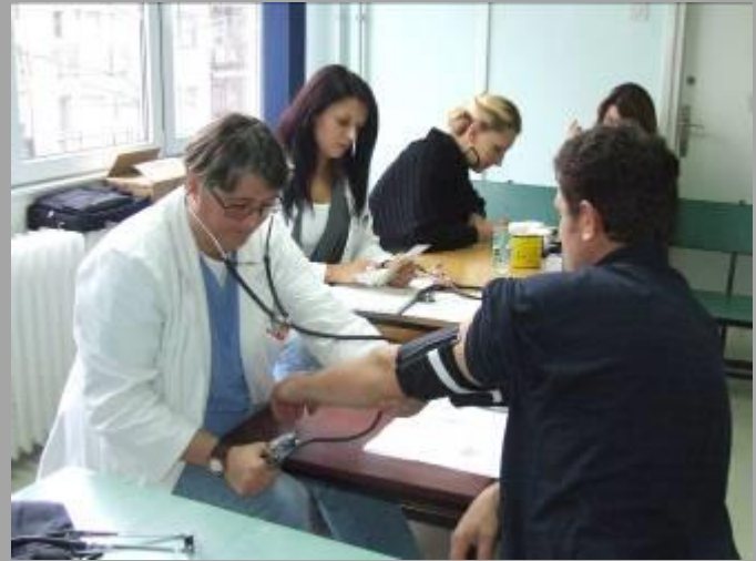
Амбуланта у „ромском“ насељу у Апатину

У насељу је отворен вртић, прилагођен потребама деце и родитеља, а боравак деце финансира општина. Из општинског буџета се обезбеђују се средства за набавку уџбеника и аутобуски превоз ученика, ужине, као и за стипендије за студенте ромске националности без обзира на материјално стање породице. Више од 90% ромске деце редовно похађа основношколску наставу, али забрињавајуће је да свега 30% од њих наставља школовање.