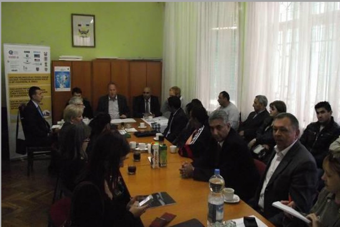
Канцеларија за инклузију Рома – са састанка у Руми

студира преко 250 ромских студената, што је више него на свим факултетима у Србији заједно. Стипендирање ученика и менторски рад са ученицима показао се као ефикасна компензација економским баријерама ученика Рома у образовању.