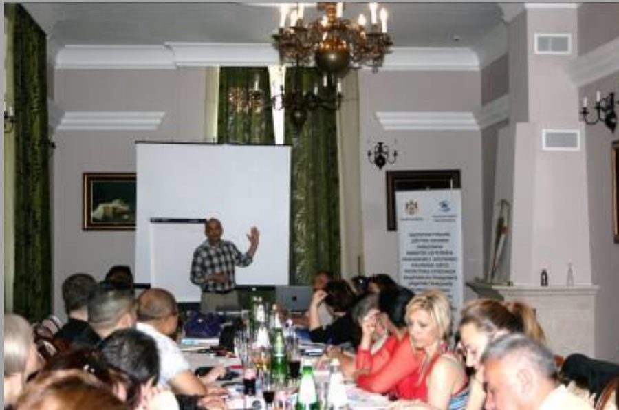
Обука за ромске координаторе коју је организовао Заштитник грађана у Ечкој

Према Истраживању Заштитника грађана две трећине испитаника сматра да „ромски координатори“ омогућавају везу између Рома и локалне власти и да доприносе већој информисаности Рома о правима која им припадају и поступцима у којима их могу остварити, а која често због страха према институцијама не остварују.