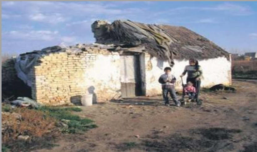
Услови у којима су живели Роми у општини Кула

Уз помоћ средстава које је обезбедила Влада Аутономне Покрајине Војводине и у сарадњи са Канцеларијом за инклузију Рома Владе АП Војводине, за десет ромских породица са више од стотину чланова, које су живеле у неформалном насељу, купљена су домаћинства у селу Сивац, а локална самоуправа је предузела и друге активности које обезбеђују пуну интеграцију Рома. Решавању проблема расељавања допринео је и центар за социјални рад који је утврдио социјални статус сваког домаћинства у неформалном насељу и помогао је да се одреде критеријуми и приоритети за доделу домаћинства.