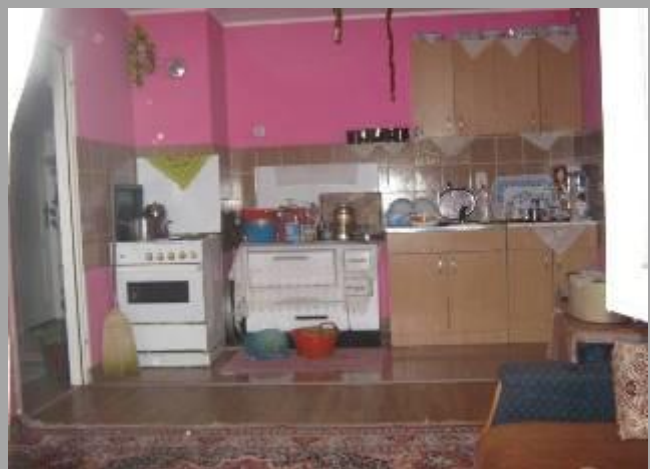
Унутрашњост једног од станова у „ромском“ насељу у Узун Мирковој у Пожаревцу

Власник станова је Град, који је са домаћинствима потписао уговоре о неограниченом коришћењу са могућношћу наслеђивања. Станарину корисници кућа не плаћају, а за најсиромашније породице обезбеђени су преко центра за социјални рад субвенције и олакшице за плаћање комуналних трошкова. Поједини становници насеља су укључени у