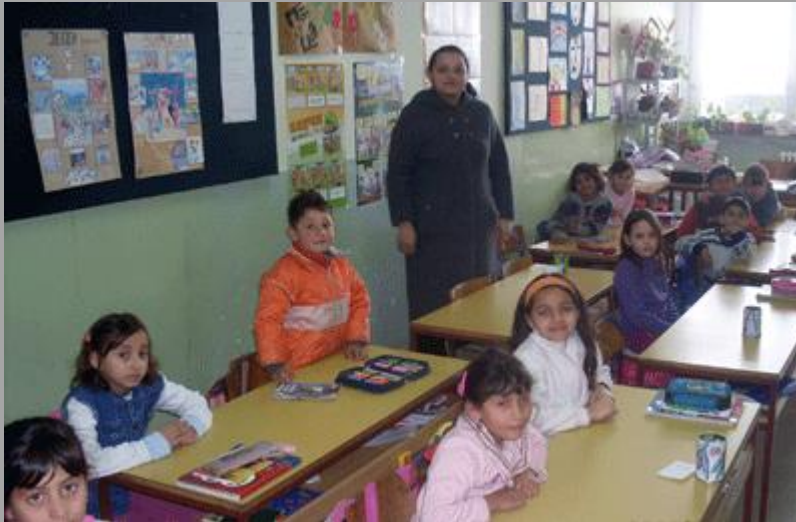
Педагошка асистентица за подршку у настави ромским ученицима У Основној школи „Јожеф Атила“ у Богојеву

локалну заједницу је огроман. Према сазнањима Заштитника грађана рад педагошких асистената за подршку ученицима ромске националности је битно допринео њиховом укључивању у наставу и друштво. Посебно су значајни резултати њиховог рада с родитељима, који често немају свест о значају и вредностима образовања и потреби да деца редовно похађају наставу и у вези са тим праве разлику између деце мушког и женског пола, које су претежно сиромашне и непросвећене и не могу деци да пруже подршку какву имају деца из других етничких група.