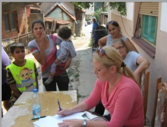
Пријем притужби у насељу „Доња Махала“ у Сурдулици

Остваривање права заштитник грађана прати непосредно у јединицама локалне самоуправе и у ромским насељима у којима организује пријем притужби на основу којих води поступке према органима јавне власти пред којима грађани остварују права.